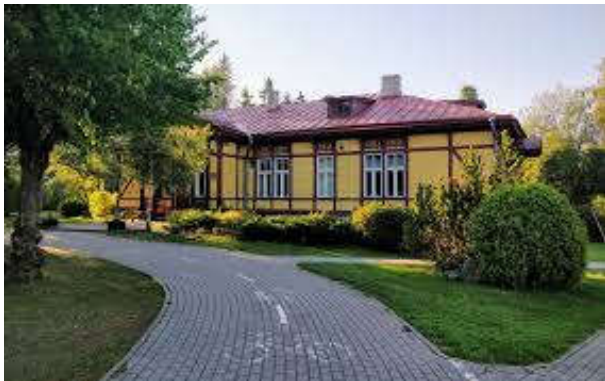
Tallinna lasteaed Kaseke